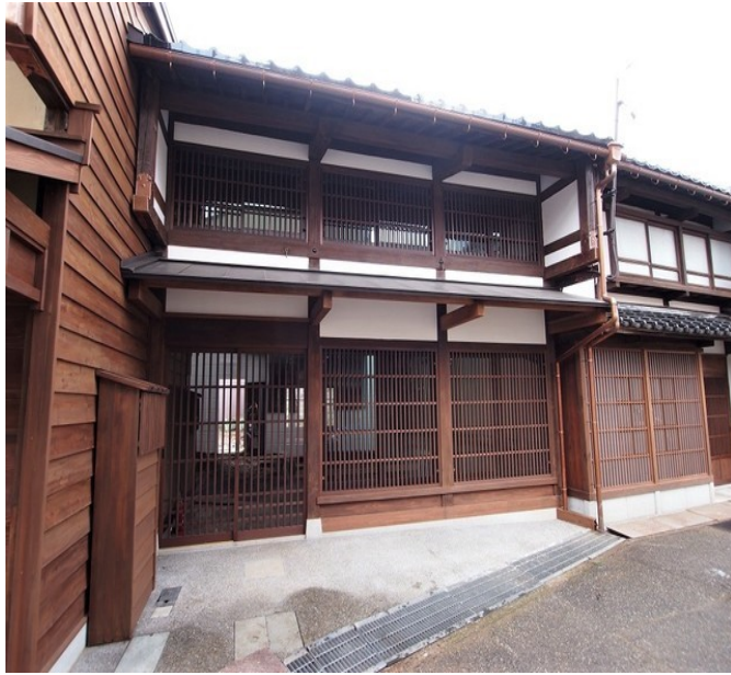
東山2丁目 金澤町屋B棟 3棟連なる金澤町屋の真中B棟になります。 A棟にはコーヒースタンド入居中